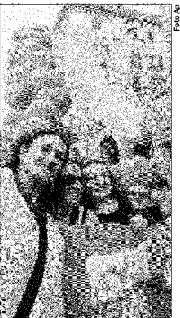
Vaccarello a pagina 10

DAL NOSTRO meschino punto di vista, quando si decise il ritorno del Savoia, temevamo più di tutto l'arrivo nei talk show degli ultimi eredi della casa, promossi opinionisti al posto delle ben più meritevoli fidanzate di calciatori (e/o bancarottieri). In realtà, tanta è la nullità fisica e verbale di Vittorio Emanuele che il fenomeno televisivo si è rivelato un vero flop. Dopo le sconce dichiarazioni del passato, sembrava che il vecchio ragazzo avesse imparato a tacere. E quand'anche avesse voluto parlare, in quel suo italiano stentato, non aveva trovato niente da dire. Intanto il figlio metteva a frutto per i suoi affarucci borghesi il nome e lo stemma, mentre la moglie, tirata e rifatta come Berlusconi, non apre neanche la bocca. Della famiglia si è interessato però Bruno Vespa, per qualche serata di recupero allestita per fare un favore a Berlusconi ed evitare il tema del referendum. Uno scivolone? Ma caspita, neanche l'anarchico Bresci avrebbe potuto pensare dei Savoia quello che emerge al disonore delle cronache.